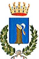
COMUNE DI RONCADE