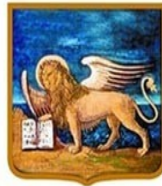
REGIONE DEL VENETO